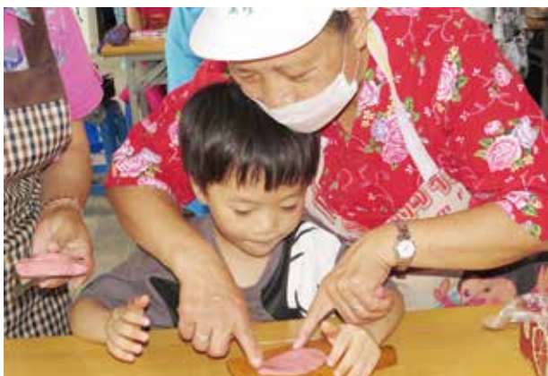
桃園市龍潭區三和社區照顧關懷據點長輩傳承三和板好手藝。

「吃板了！」桃園市龍潭區三和社區照顧關懷據點的長輩拿出剛蒸好的紅粿，與在據點裡「答嘴鼓」的長輩們，都笑呵呵地拿起一塊品嚐。一會兒說內餡「好呷」，一會兒說粿皮很Q…。這是三和社區照顧關懷據點的日常一景，在衛生福利部社會及家庭署（簡稱社家署）於2017年所推出的台灣據點趴趴走2-《據點漫步：你所不知道的據點生活！》中，還有更多關懷據點有趣場景，等待民眾去挖掘，體會其中樂趣。