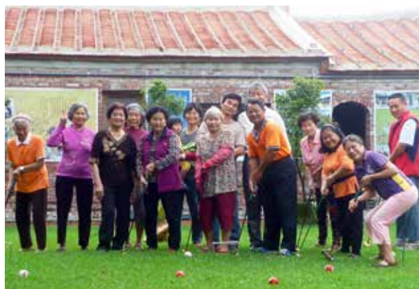
長輩們於柴林腳社區照顧關懷據點一起參與健促活動，預防及延緩失能。

爲了落實在地老化政策，鼓勵長輩積極參與社會，社家署自2005年起推動「建立社區照顧關懷據點」，由有意願的村里辦公處及民間團體參與設置，透過志工人力的運用，提供老人關懷訪視、電話問安、餐飲服務及辦理健康促進活動，十餘年來，已於全國設置2,888個社區照顧關懷據點，在社區中發揮預防失能、延緩失智的初級預防照顧功能。